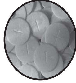
Small Host Rs. 80/-

மறையாவட்ட பள்ளி ஆசிரியர்களின் பங்களிப்பு தொகை விவரம்