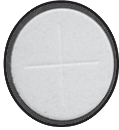
Big Host Rs. 50/-